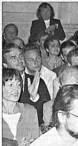
Zahlreiche Besucher kamen i rythmen ebenso gelauscht v